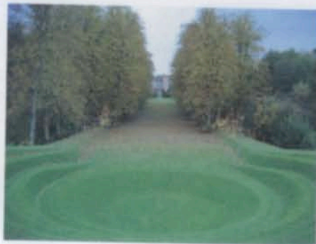
Ничто теперь не нарушает тишину и чистоту садовых видов.