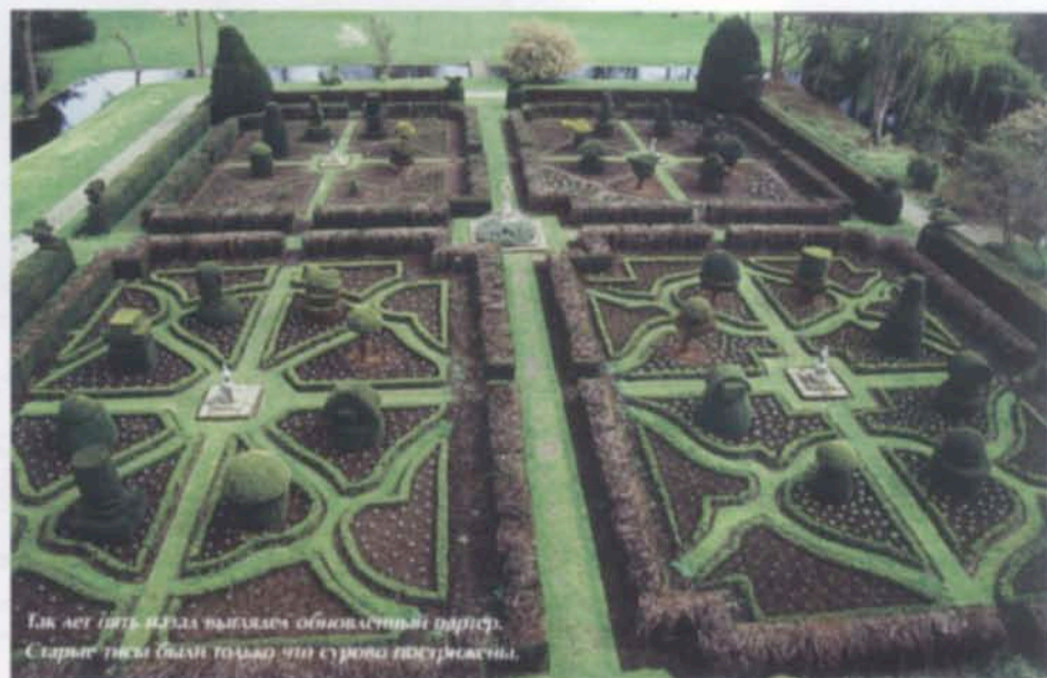
Так лет пять назад выглядел обновленный партер. Старые тисы были только что строго подстрижены.

На протяжении веков аристократические гнезда Англии были не только ареной политических и культурных интриг в среде социальной элиты, но и оказывали существенное влияние на развитие искусства и общества. Преобразование «Грейт Фостерс» в 1920-е годы в первый сельский аристократический отель в стране стало началом социального явления, которое, распространившись затем по всей Европе, способствовало сближению