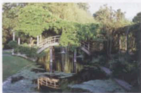
...и дополнительно укреплять на новых дубовых опорах, установленных на спрятанных под водой бетонных основаниях.

все более урбанизированного общества с природой.