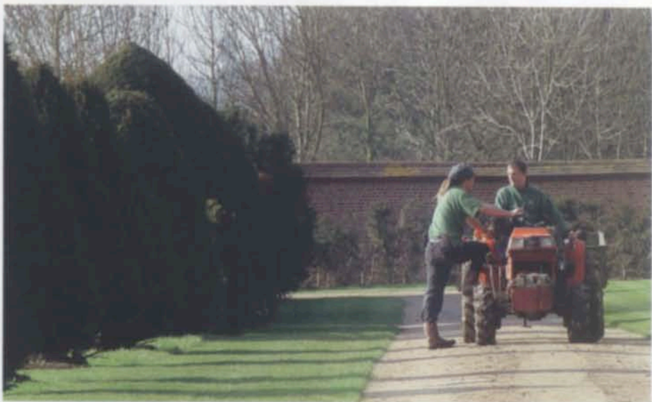
Теперь, когда реставрация садов закончена, со всем хозяйством будут справляться два постоянных квалифицированных садовника.