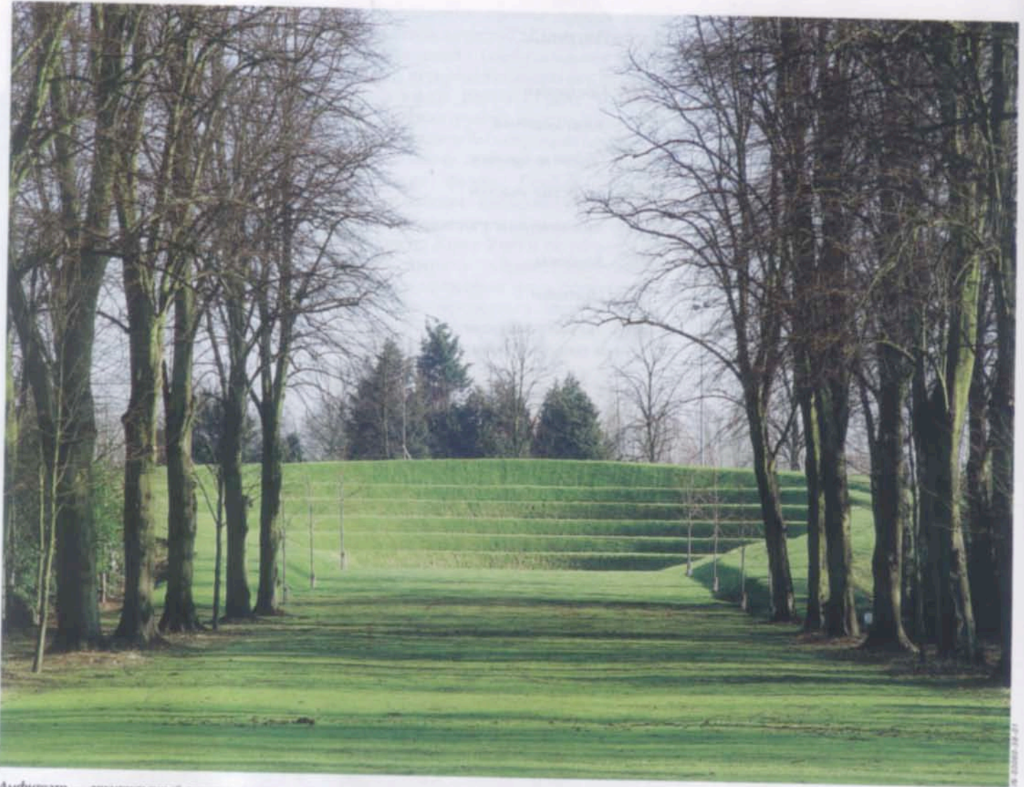
Амфитеатр — архитектурный артефакт, восходящий к античности. Садовым элементом он тоже стал давно — не позже XVIII века (образцы есть и в Англии). Однако в современном саду смотрится вполне свежо и уместно, тем более если такому сооружению предписано кроме декоративной нагрузки нести еще и функциональную, в данном случае — защиту всей садовой композиции, всего исторического ландшафта от губительного соседства с самой оживленной трассой самого крупного мегаполиса Европы.