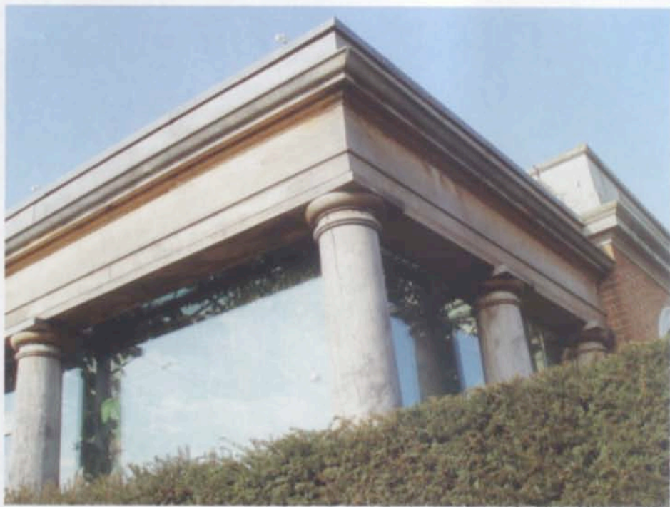
Еще один пример сочетания старого и нового: ограждение для приемов выполнено в классических архитектурных формах, но из необычного материала — некрашеного дуба.

С другими работами Kim Wilkie Associates можно познакомиться на сайте www.kimwilkie.com