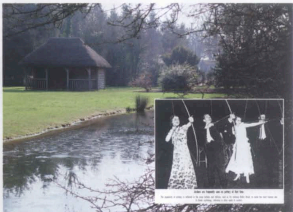
На прежнем месте в первоначальном виде был воссоздан крытый камышовой крышей садовый павильон с экзотическим по нынешним временам назначением: хранение инвентаря для стрельбы из лука — молчаливое напоминание 1930-х.