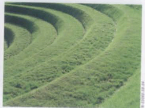
Геопластика приходит на помощь, когда другие средства ландшафтного дизайна бессильны.