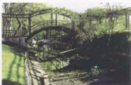
Старый арочный мост через ров пришлось перебирать по доскам...