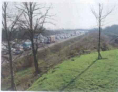
Километровый земляной вал защищает земли от М25 — кольцевой автостралы вокруг Лондона.